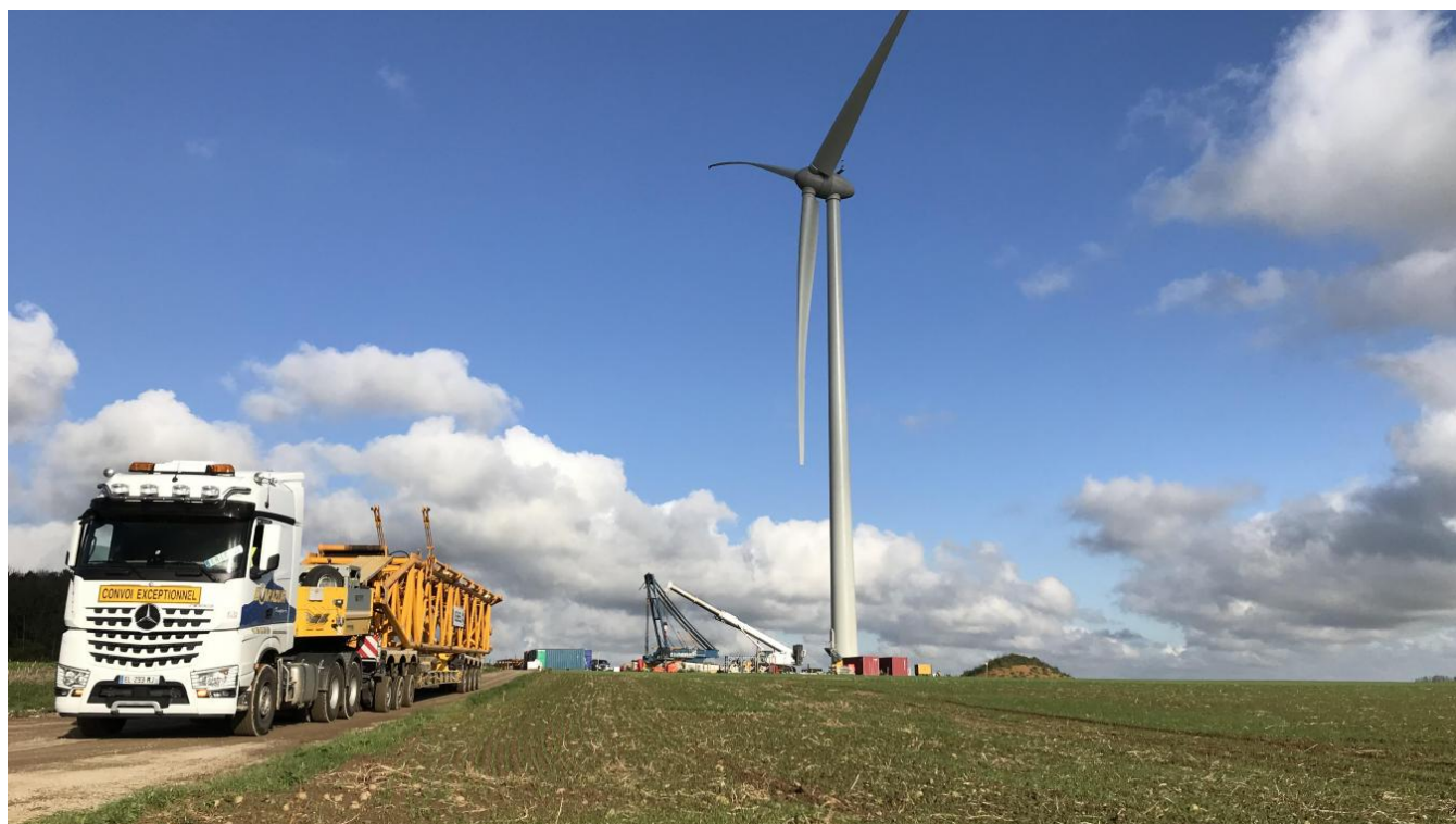
Le parc éolien du Fond Saint-Clément, à Caulières, s'agrandit. Dix nouvelles éoliennes sortent du sol et sont financées par des particuliers à hauteur de 200 000 €.

Par Le Courrier Picard | Publié le 27/10/2017